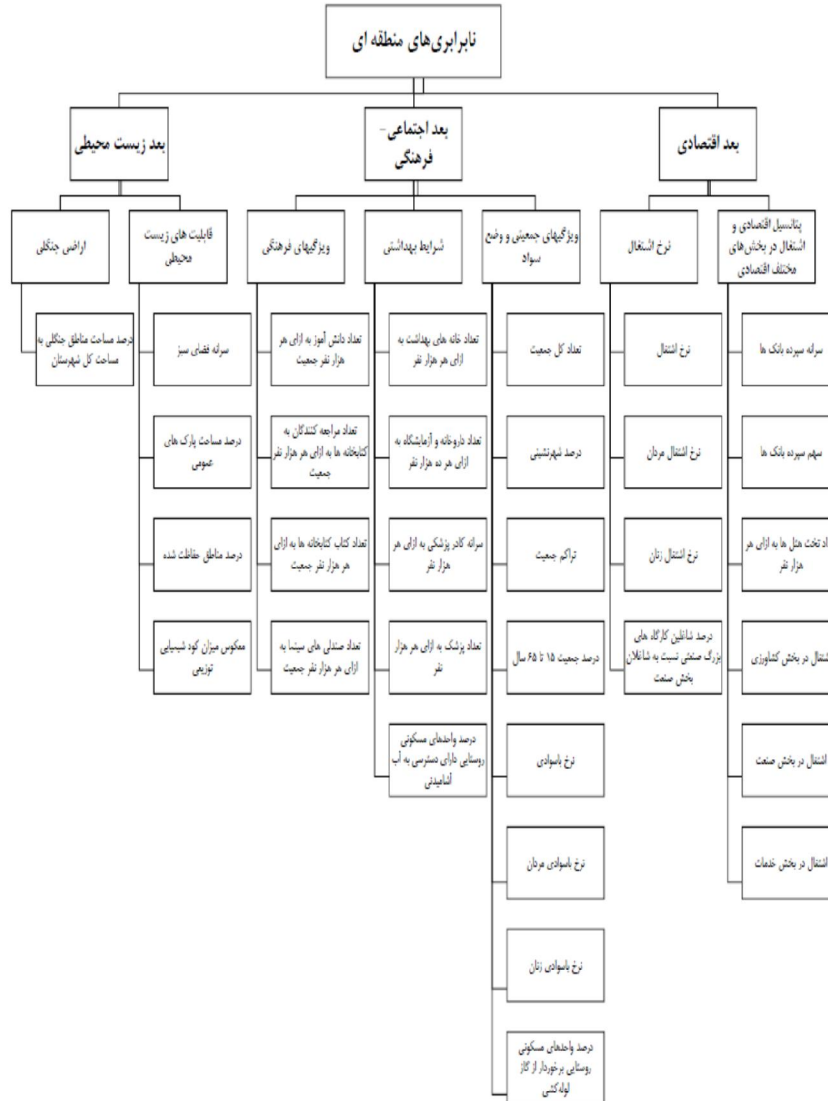
نمودار (۲): شاخص‌های سنجش نابرابری منطقه‌ای براساس مدل تحلیل عاملی

در نمودار (۲)، شاخص‌های سنجش نابرابری منطقه‌ای براساس مدل تحلیل عاملی ارائه شده است.