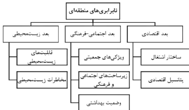
نمودار (۱): مدل مفهومی نابرابری منطقه‌ای

- مدل مفهومی نابرابری‌های منطقه‌ای: در این مدل علاوه بر ابعاد اقتصادی، ابعاد اجتماعی، فضایی و جمعیتی نیز مدنظر قرار گرفته است و با تعیین موضوعات ذیل هر بُعد، شاخص‌های نابرابری منطقه‌ای استخراج می‌شود (کاسچرایر و همکاران، ۲۰۱۰). بر این اساس، چگالی جمعیت در هر منطقه نیز بر توزیع درآمد منطقه‌ای اثرگذار است. مبانی نظری تشریح شده و مطالعات تجربی، مدل مفهومی نابرابری منطقه‌ای در نمودار (۱) ارائه شده است.